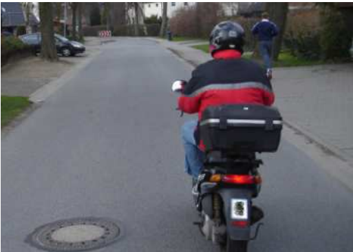
Bild 2: Ein Rollerfahrer und ein Läufer wurden durch „Hindernisse“ (Baum / A-Säule) verdeckt!