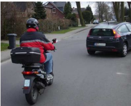
Bild 3: Bereits durch einen ungünstigen Blickwinkel wird der Rollerfahrer hinter dem abbiegenden Fahrzeug leicht übersehen!